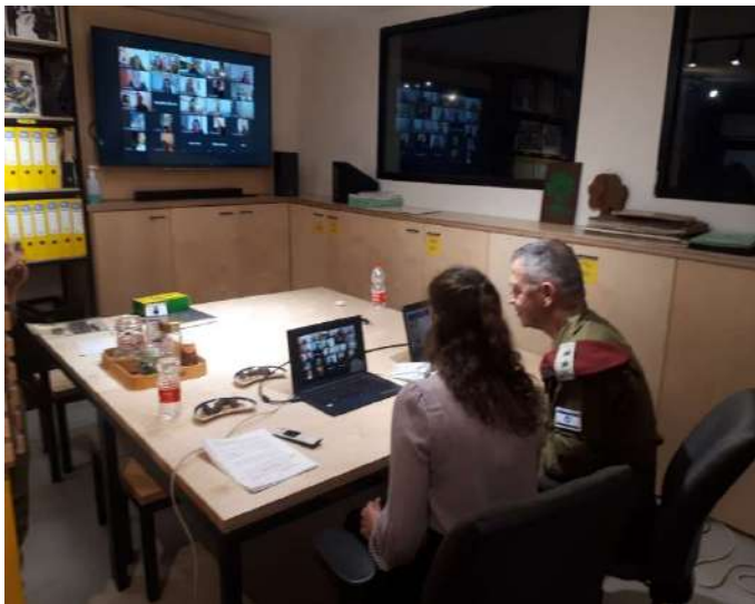
הרמטכ"ל ורעיתו בשיחת זום עם נשות מפקדי גולני

** הרמטכ"ל ואישתו הגיעו לבית מורשת גולני וקיימו שיחת זום עם נשות מפקדים בחטיבה. רצ"ב תמונה.