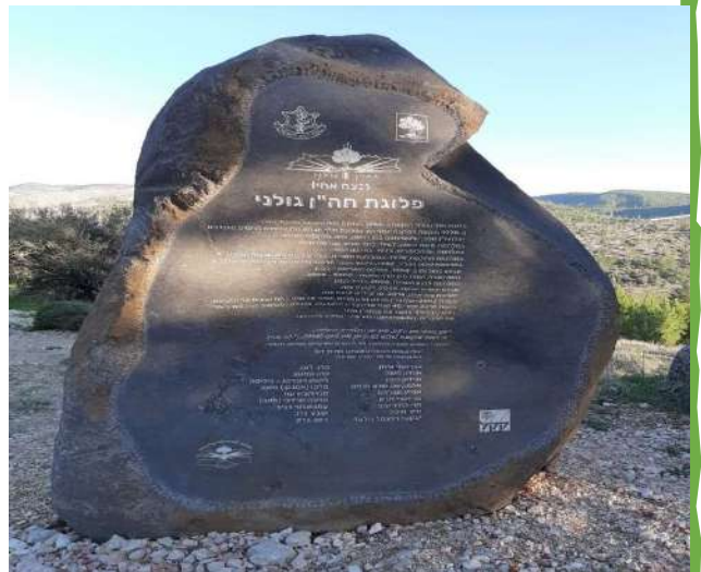
אתר פלח"ן ביער כפירה, שבפארק אילון