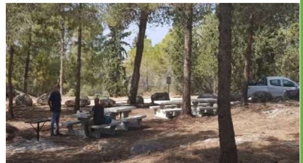
לחטיבת גולני, על מפקדיה וחייליה לאורך הדורות,

הערכה עצומה! עצומה - על שנים של הקרבה, מסירות, מקצועיות, רוח בכלל ורוח לחימה בפרט.