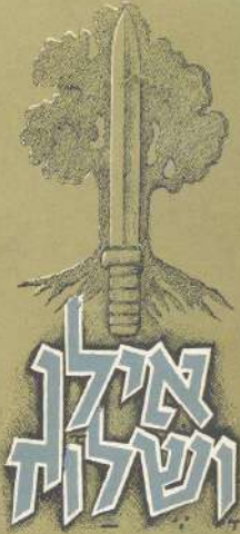
דרך הקרבות של חטיבת גולני