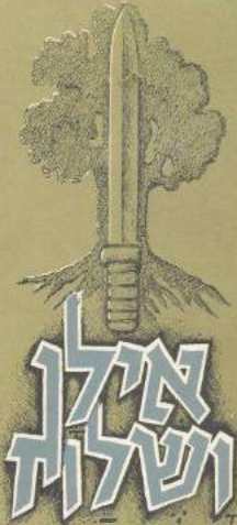
דרך הקרבות של חטיבת גולני