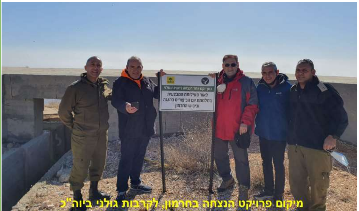
מיקום פרויקט הנצחה בחרמון, לקרבות גולני ביוה"כ