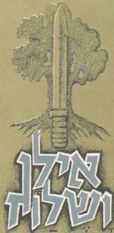
דרך הקרבות של חטיבת גולני