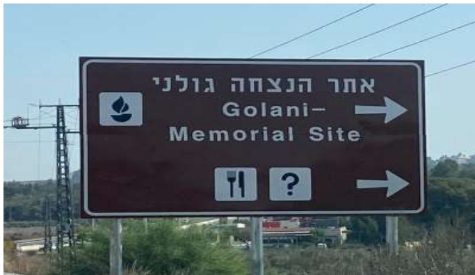
השילוט החדש שהוצב בצומת גולני

חטיבת גולני מתכבדת להזמין לטקס התייחדות השנתי לזכר חללי החטיבה, שיתקיים ביום שלישי 18/10/2022 בשעה 18:00 באתר הנצחה והמורשת החטיבתי בצומת גולני. פרטי הטקס, לרישום הסעות, בתמונה המצורפת.