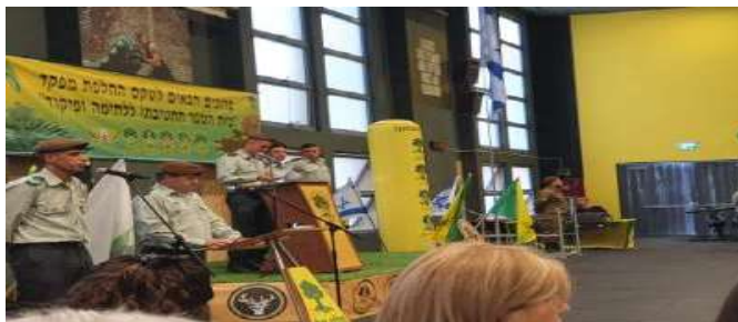
טקס חילופי מפקדי בא"ח