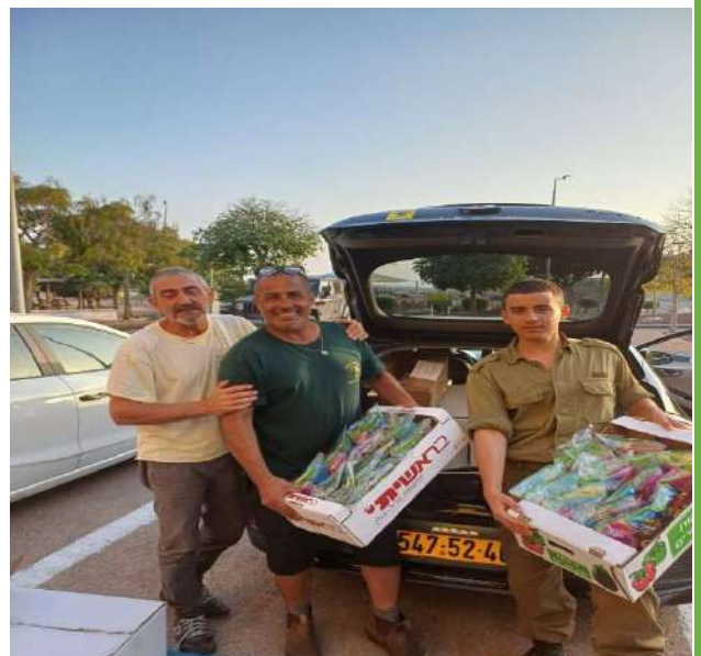
חלוקת ערכות לפצועים